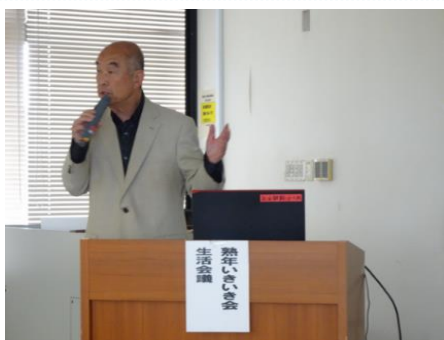
(熟年いきいき会生活会議)

その後、熟年いきいき会では、様々な活動を立ち上げ、お花見や紅葉狩り、日帰りバス旅行、カラオケ同好会、おしゃべりサロン等の人生を楽しむ会の報告、伴侶を亡くした人が語り合う会や老後の相談に対応する熟年よろず無料相談会等の説明がありました。最後に、会員確保への課題についてもお話しされました。