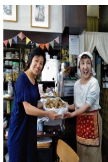
(グリーンリンク生活学校)