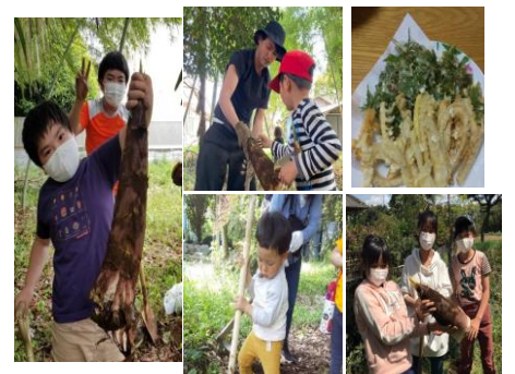
(グリーンリンク生活学校)