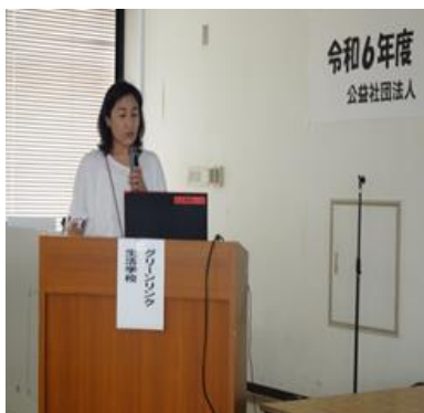
(グリーンリンク生活学校)

最後に、食の安全を第一に考え、楽しく・美味しくをモットーに活動を行っているとの報告がありました。