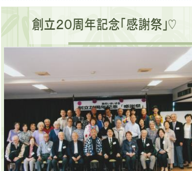
(熟年いきいき会生活会議)