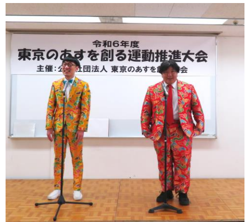
いち・もく・さん