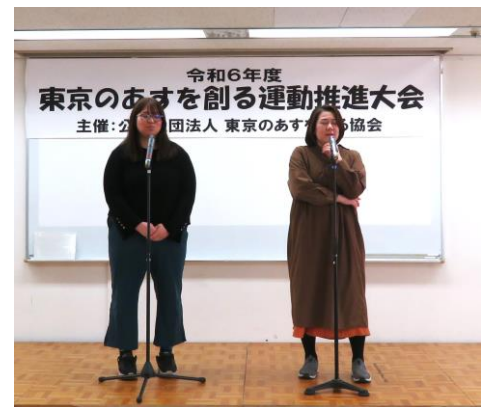
ユニットアクトリー